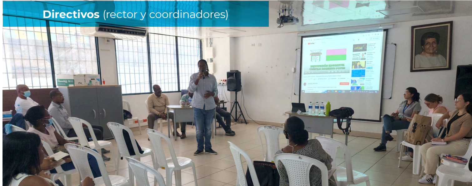
Directivos (rector y coordinadores)