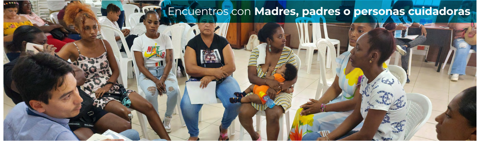
Encuentros con Madres, padres o personas cuidadoras

Algunos estudiantes manifiestan que los docentes les informan sobre las temáticas previo a la prueba para que se preparen para la evaluación. Los docentes también les refuerzan contenidos en el aula posterior a la aplicación y esto les parece favorable porque pueden repasar ciertos temas.